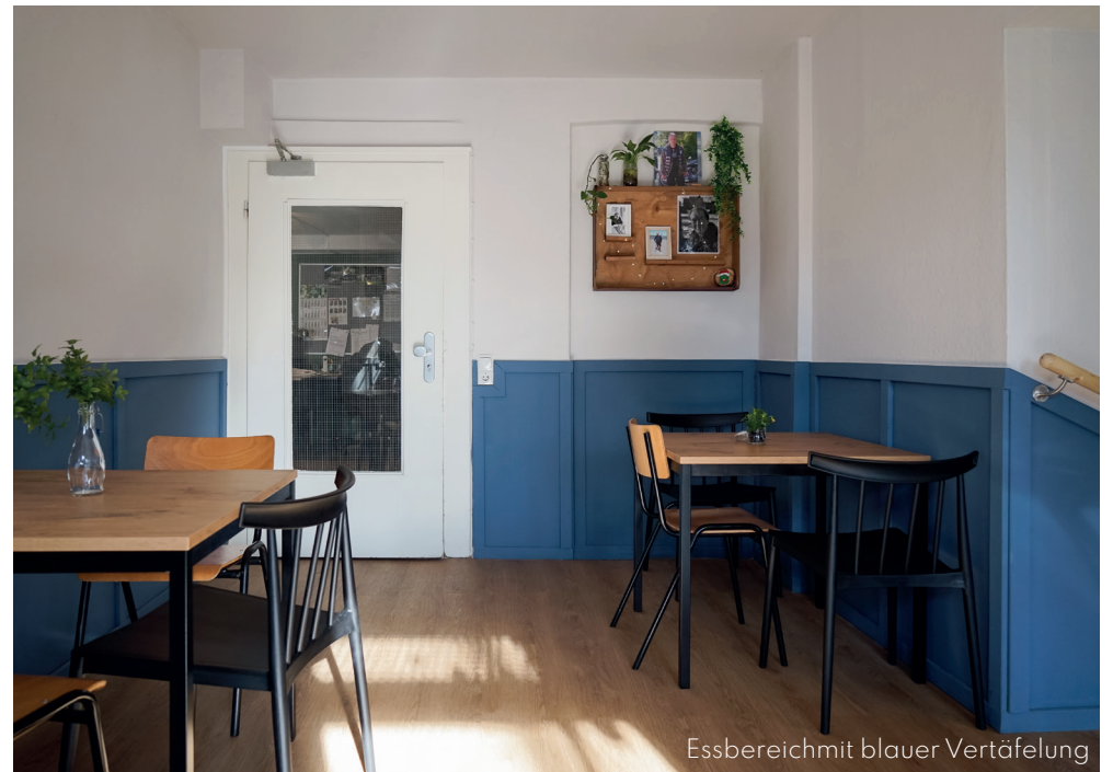
Essbereich mit blauer Vertäfelung